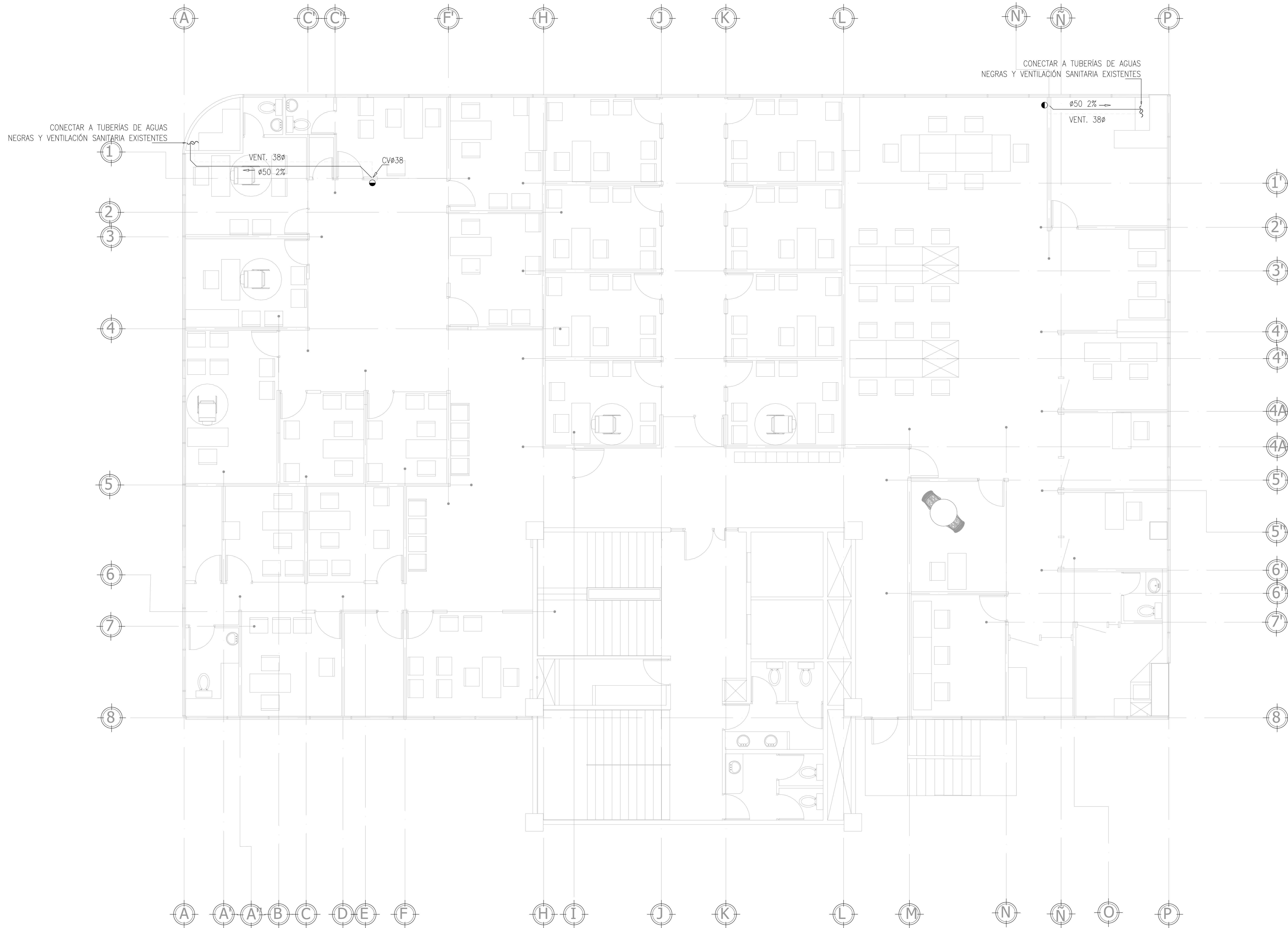
PLANTA DE AGUAS NEGRAS NIVEL 3 ESCALA 1:50